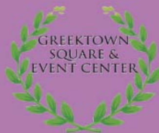
SECOND FLOOR BANQUET HALL FOR UP TO 400 GUESTS