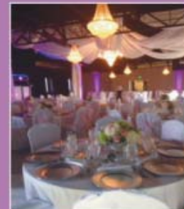
OUTDOOR VENUE WITH AMPHITHEATRE STAGE AND DANCE FLOOR FOR UP TO 1,500 GUESTS

701 QUAIL STREET BALTIMORE, MD 21224 • (410) 294-1253 • WWW.GREEKTOWNSQUARE.COM