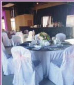
FIRST FLOOR HALL FOR UP TO 175 GUESTS

WEDDING RECEPTIONS • ANNIVERSARY CELEBRATIONS • BIRTHDAY PARTIES NEW YEAR'S EVE • COMPANY GATHERINGS • CLASS OR FAMILY REUNIONS RETIREMENT PARTIES • BUSINESS MEETINGS