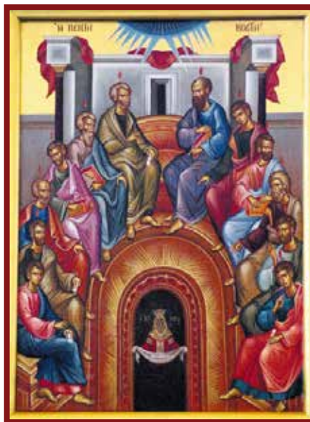
Sunday of Holy Pentecost