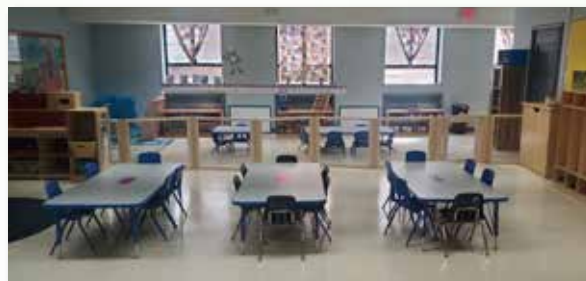
The preschool 2s and 3s areas