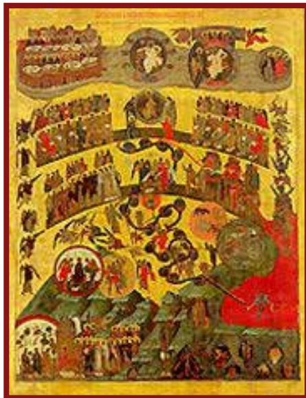
Saturday of Souls