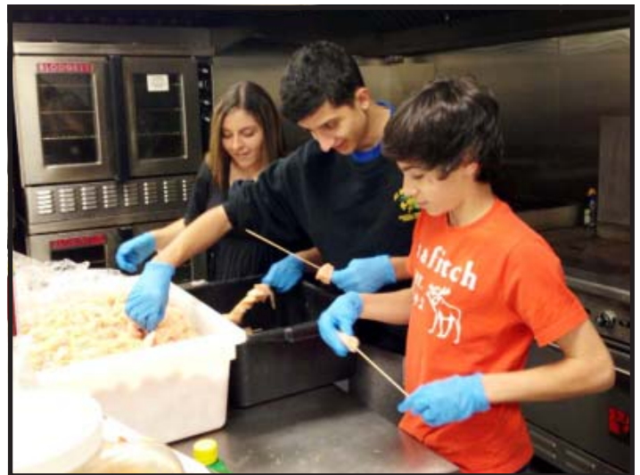
Pictured below: GOYANS making palms for Palm Sunday Celebrations.

"For I know the plans I have for you," declares the LORD, "plans to prosper you and not to harm you, plans to give you hope and a future. Then you will call upon me and come and pray to me, and I will listen to you. You will seek me and find me when you seek me with all your heart."