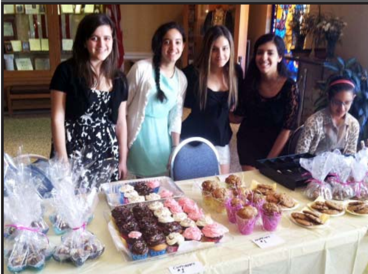
(Left) GOYANS selling desserts at their annual Mother's Day Bake Sale.