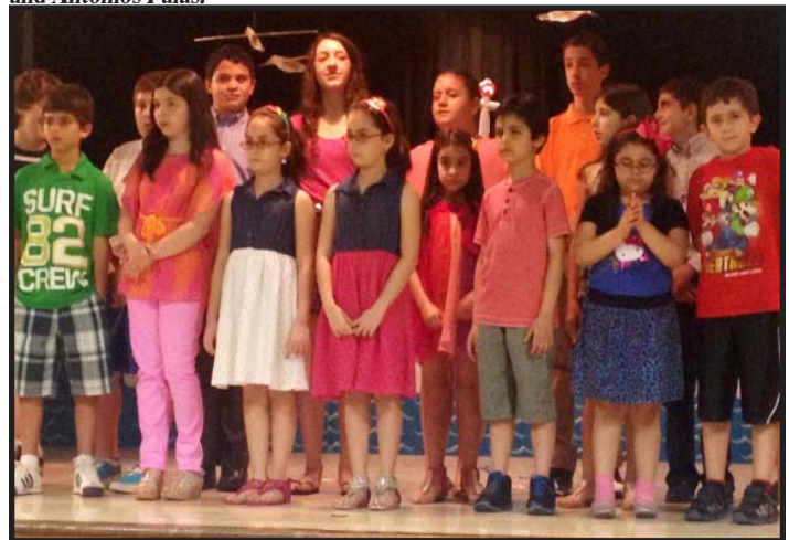
Greek School students assembled on stage preparing to sing the Greek National Anthem at the opening of the Greek School End Of Year Program.

Η Κοινότητα του Αγίου Νικολάου προσφέρει για πέμπτη συνεχή χρονιά το Ελληνικό Καλοκαιρινό Πρόγραμμα 24 Ιουνίου- 19 Ιουλίου, 2013 για παιδιά ηλικίας 4-6 χρονών