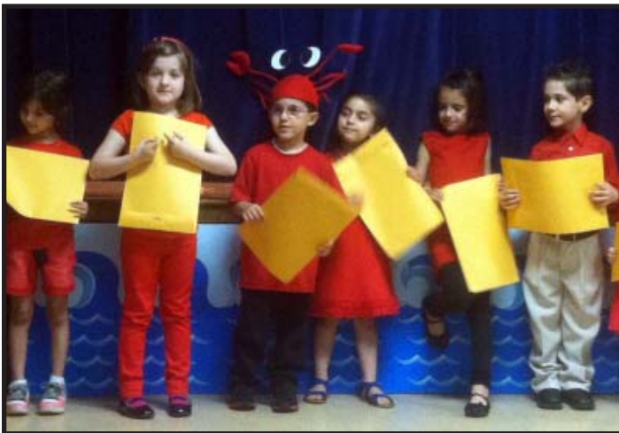
Pictured are some of the St. Nicholas Greek School Kindergartens receiving their Greek School Certificate for year well done.