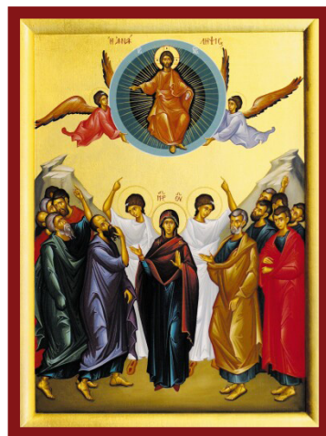
Holy Ascension of our Lord