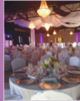
OUTDOOR VENUE WITH AMPHITHEATRE STAGE AND DANCE FLOOR FOR UP TO 1,500 GUESTS

701 QUAIL STREET BALTIMORE, MD 21224 • (410) 294-1253 • WWW.GREEKTOWNSQUARE.COM