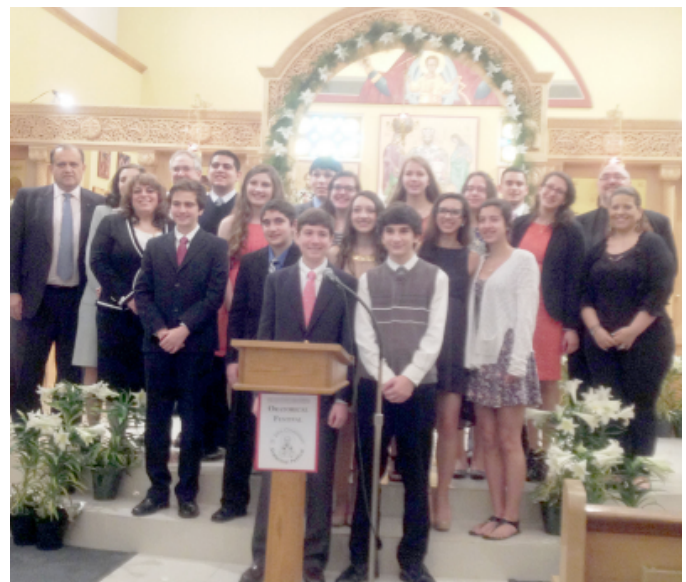
Pictured are all the Junior finalists from the various churches in Maryland who participated at the district level of the Oratorical Festival.