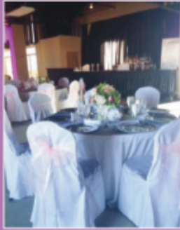
FIRST FLOOR HALL FOR UP TO 175 GUESTS

WEDDING RECEPTIONS • ANNIVERSARY CELEBRATIONS • BIRTHDAY PARTIES NEW YEAR'S EVE • COMPANY GATHERINGS • CLASS OR FAMILY REUNIONS RETIREMENT PARTIES • BUSINESS MEETINGS