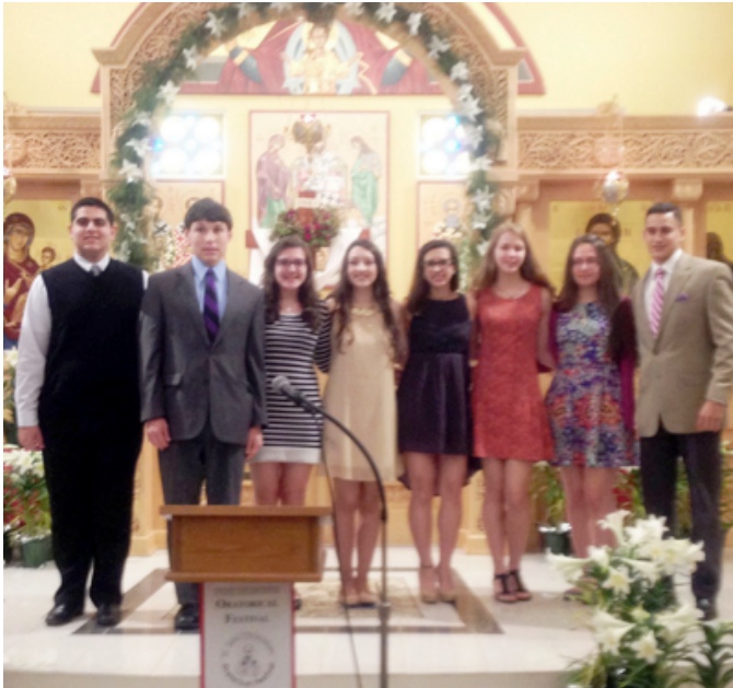
Pictured are all the Senior Finalists from the other Greek Orthodox churches in Maryland who participated at the District Level of the Oratorical Festival at St. Theodore's church in Lanham, MD.

St. Nicholas finalists participated at the district level of the St. John Chrysostom Oratorical Festival at St. Theodore Greek Orthodox Church in Lanham, MD, on Saturday, April 18, 2015. Congratulations to all of the finalists, and special congratulations to the two Seniors and two Juniors who will represent our state at the next level of competition, the diocese Level.