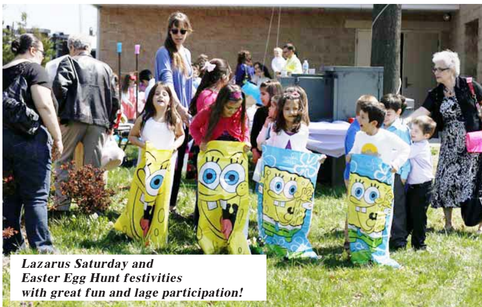
Lazarus Saturday and Easter Egg Hunt festivities with great fun and lage participation!