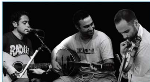
Metron Ariston Friday, Saturday, and Sunday nights