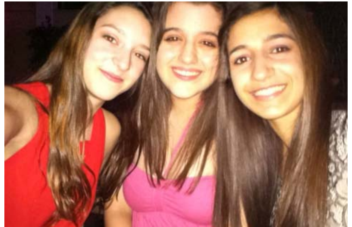
St. Nicholas GOYA members enjoying themselves at the Holy Trinity tournament dance.

We would also like all of the St. Nicholas parishioners to come out and cheer our GOYA Girls A and B teams and Boys A and B teams on to victory. Thank you in advance for your support and help!