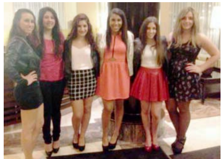
Our girls ready for the Holy Trinity tournament dance.