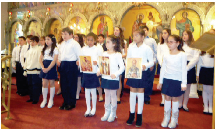
Greek School students commemorating the Three Hierarchs.