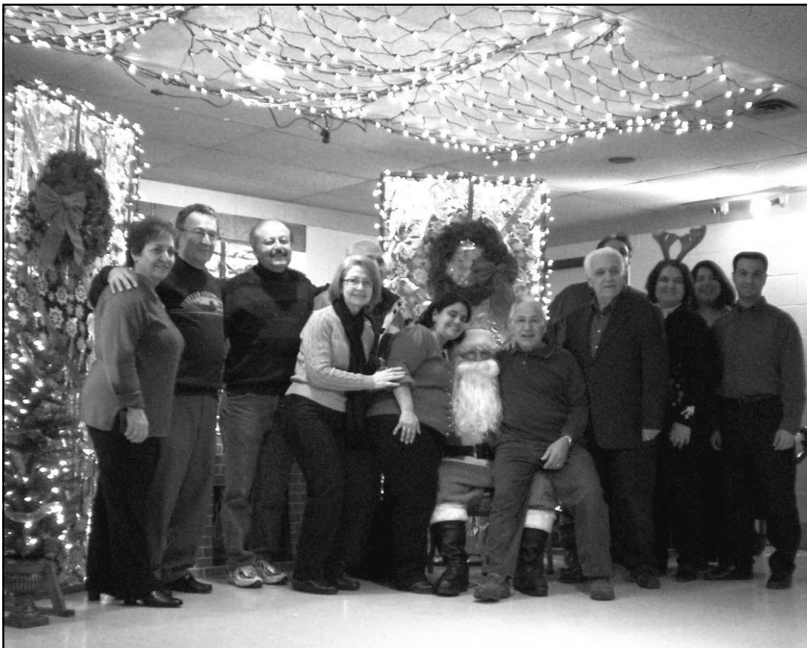
Left: The Board members of Diagoras hosted the Annual Breakfast with Santa this past Christmas.