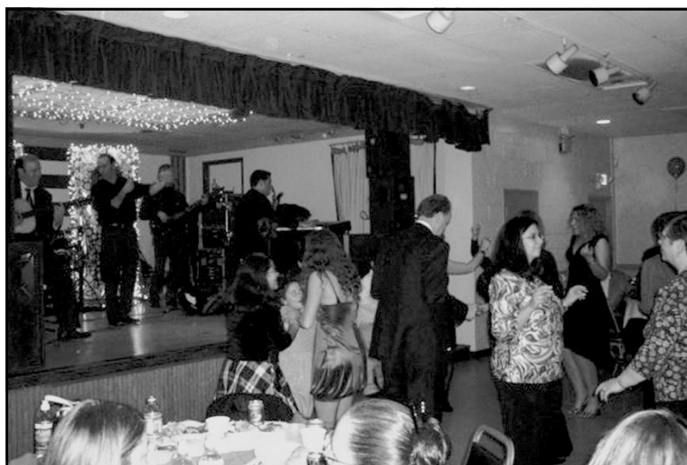
Right: Name Day Dance was entertaining and enjoyable.