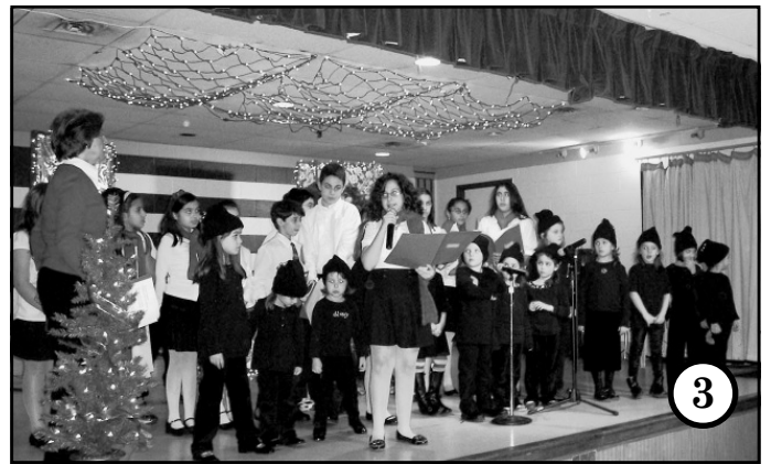
1. Our dedicated Goya advisors/parents. 2. Young children with Santa. 3. Greek school students at their Christmas program. 4. The dance group Ellinakia hosting a Christmas fundraiser.