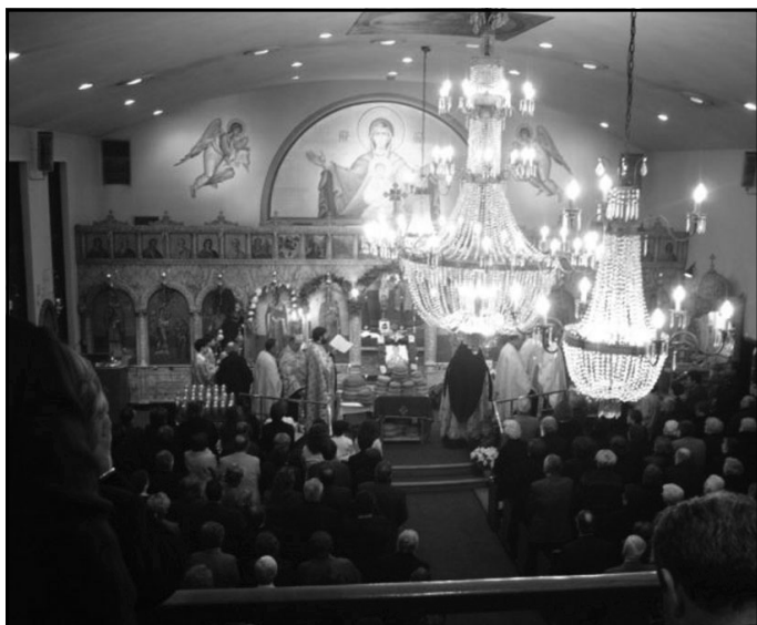
Right: Our choir singing the Kalanda on Christmas Eve services.