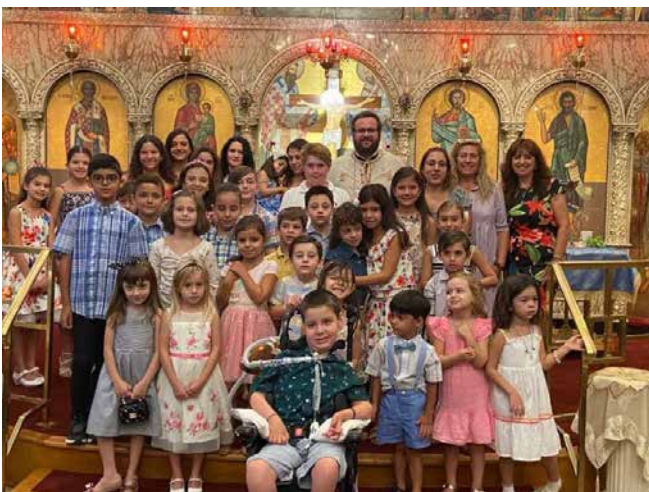
Agiasmos for the new School Year at Saint Nicholas Greek Orthodox Afternoon School.