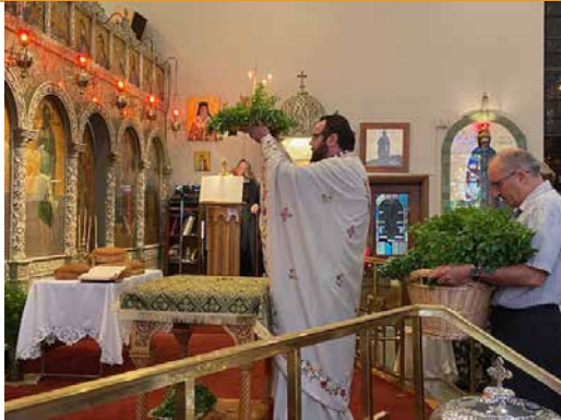
The Elevation of the Venerable and Life-Giving Cross / Ἡ Ὑψωσις τοῦ Τιμίου Σταυροῦ celebrated September 14th at St. Nicholas Greek Orthodox Church.